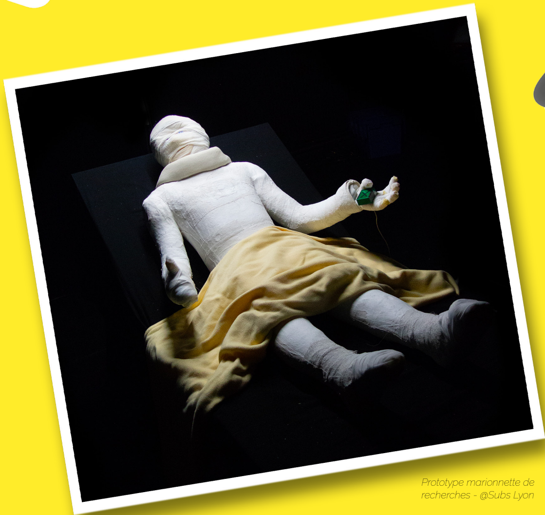
Prototype marionette de recherches - @Subs Lyon